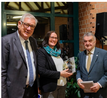
Arndt Kirchhoff, Ines Gerke-Weipert und Herbert Reul (Minister des Innern des Landes NRW)

Fast 200 Gäste hatten sich zum diesjährigen Akademieabend am 10. November eingefunden, um den Vortrag des nordrhein-westfälischen Ministers des Innern zum Thema „Zeitenwende in der Inneren Sicherheit – Wie globale Konflikte die Bedrohungslage verändern“ zu verfolgen und dem politischen „Urgestein“ Herbert Reul ihre Fragen zu stellen.