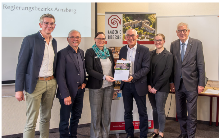
Übergabe des Zuwendungsbescheids

Die steigenden Energiekosten vor allem der vergangenen Jahre machen der Akademie stark zu schaffen. Zudem wird – nicht erst seit der Zertifizierung als BNE-Einrichtung – der Blick auch auf das Thema Nachhaltigkeit gerichtet. Daher wurde entschieden, im Rahmen einer großen Baumaßnahme die Fenster und Außentüren durch moderne Modelle zu ersetzen, das Dach und die Fassade zu dämmen und ersteres neu zu decken. Die Heizung soll auf ein hybrides System aus Erdwärme und Gasbrennwerttherme umgestellt werden, die Lüftungsanlage ertüchtigt und um eine Wärmerückgewinnungsfunktion ergänzt werden. Zudem wird das Dach mit PV-Modulen zur Stromerzeugung ausgestattet (was allerdings