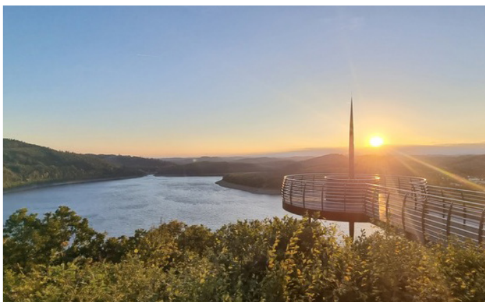
Aussichtsplattform Biggeblick: Atemberaubende Aussicht auf den Biggensee

Preis: 330 € / 600 € bei gemeinsamer Anmeldung von mindestens zwei Personen