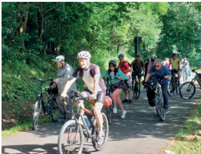
Einer unserer Bildungsurlaube auf Tour